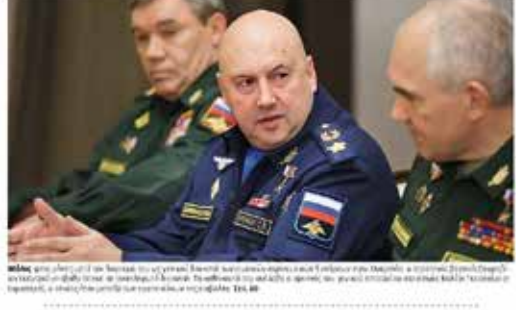
Μέλος της διοίκησης του στρατού, ο αρχηγός του στρατού, ο αρχηγός της αεροπορίας, ο αρχηγός της ναυτικής, ο αρχηγός της αεροπορίας και ο αρχηγός της αεροπορίας.