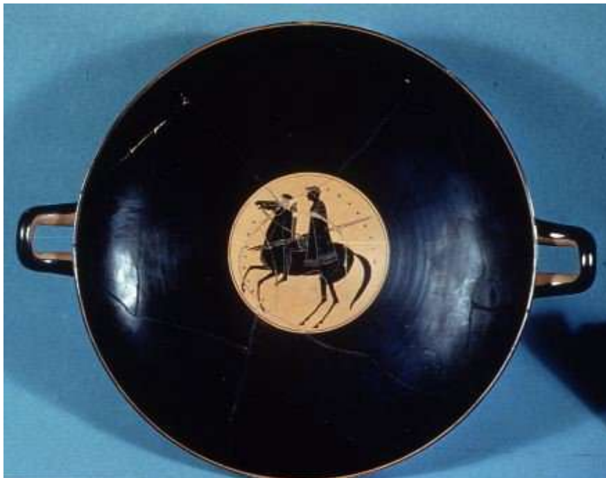
Εσωτερικό από Αττικό μελανόμορφο κύλικα του Ισχύλου. Ζωγραφίστηκε από τον Επίκτητο με παράσταση Αθηναίου ιππέα και χρονολογείται γύρω στο 520 π.Χ. Λονδίνο Βρετανικό Μουσείο: London E 3

Οι Αθηναίοι όμως διάγουν την περίοδο των Μηδικών Πολέμων χωρίς την υποστήριξη ιππικού. Γύρω στο 442 π.Χ., όταν επώνυμος άρχων ήταν ο Δίφιλος, πιθανόν με νόμο του Περικλέους το σώμα το ιππέων αυξάνεται σε χίλιους άνδρες. Πέρα από τους οπλίτες, λοιπόν, κάθε Αθηναϊκή φυλή ήταν υποχρεωμένη να παράσχει έναν αριθμό ιππέων. Τους ιππείς κάθε φυλής διοικούσε ο φύλαρχος. Οι φύλαρχοι διοικούνταν από δύο ίππαρχους που είχαν την συνολική διοίκηση του ιππικού και εκλέγονταν κάθε χρόνο. Το